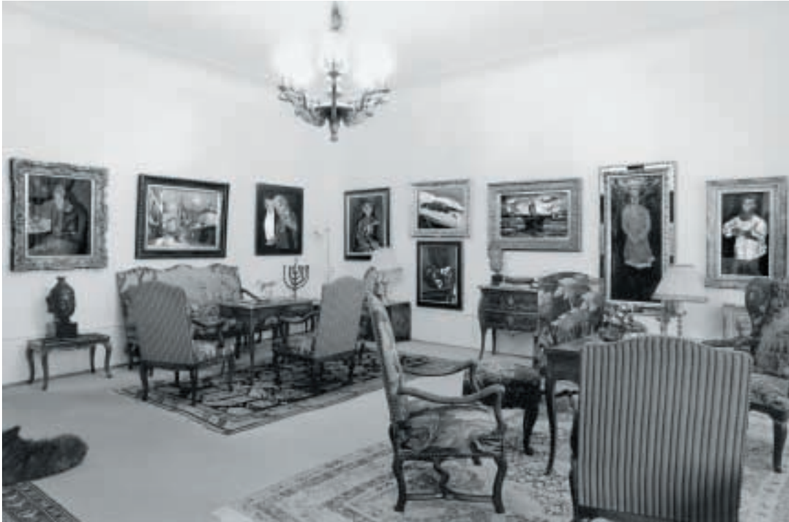
8a Salon im Hause Doris und Jürg Im Obersteg an der Petersgasse, Basel