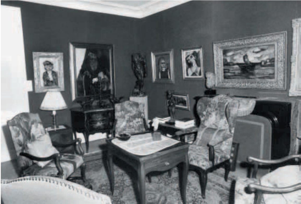
18 Die Hangung der Sammlung im Salon der Wohnung von Karl Im Obersteg, Cours des Bastions 4, Genf