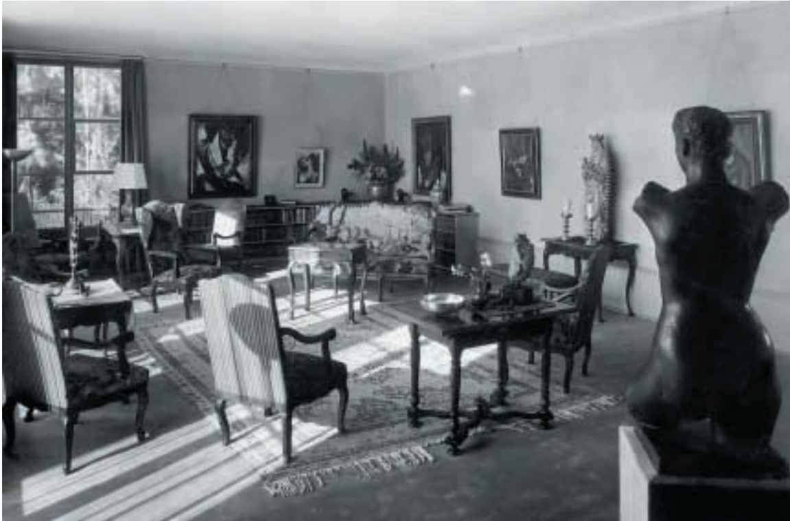
8b Salon im Hause Karl Im Obersteg im Gellert, Basel