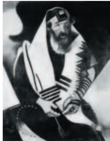
15 Marc Chagall, Der Jude in Schwarz-Weiss , 1922/23, Öl auf Leinwand, 104 x 84 cm, Galleria Municipale, Venedig