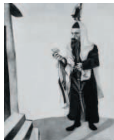
17 Marc Chagall, Festtag , 1914, Öl auf Karton auf Leinwand aufgezogen, 100 x 81 cm, Kunstsammlung Nordrhein-Westfalen, Düsseldorf (ehemals Sammlung Im Obersteg)