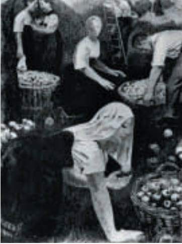
3 Cuno Amiet, Die Obsternte , 1926, Öl auf Leinwand, 149 x 109 cm, 1931 in München verbrannt (ehemals Sammlung Im Obersteg)