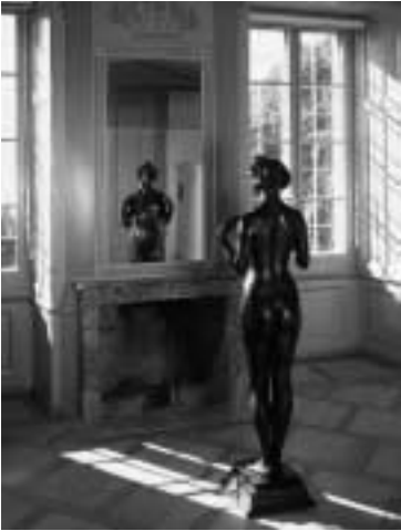
19 Le printemps von Aristide Maillol, ausgestellt im Wichterheer-Gut, Oberhofen am Thunersee