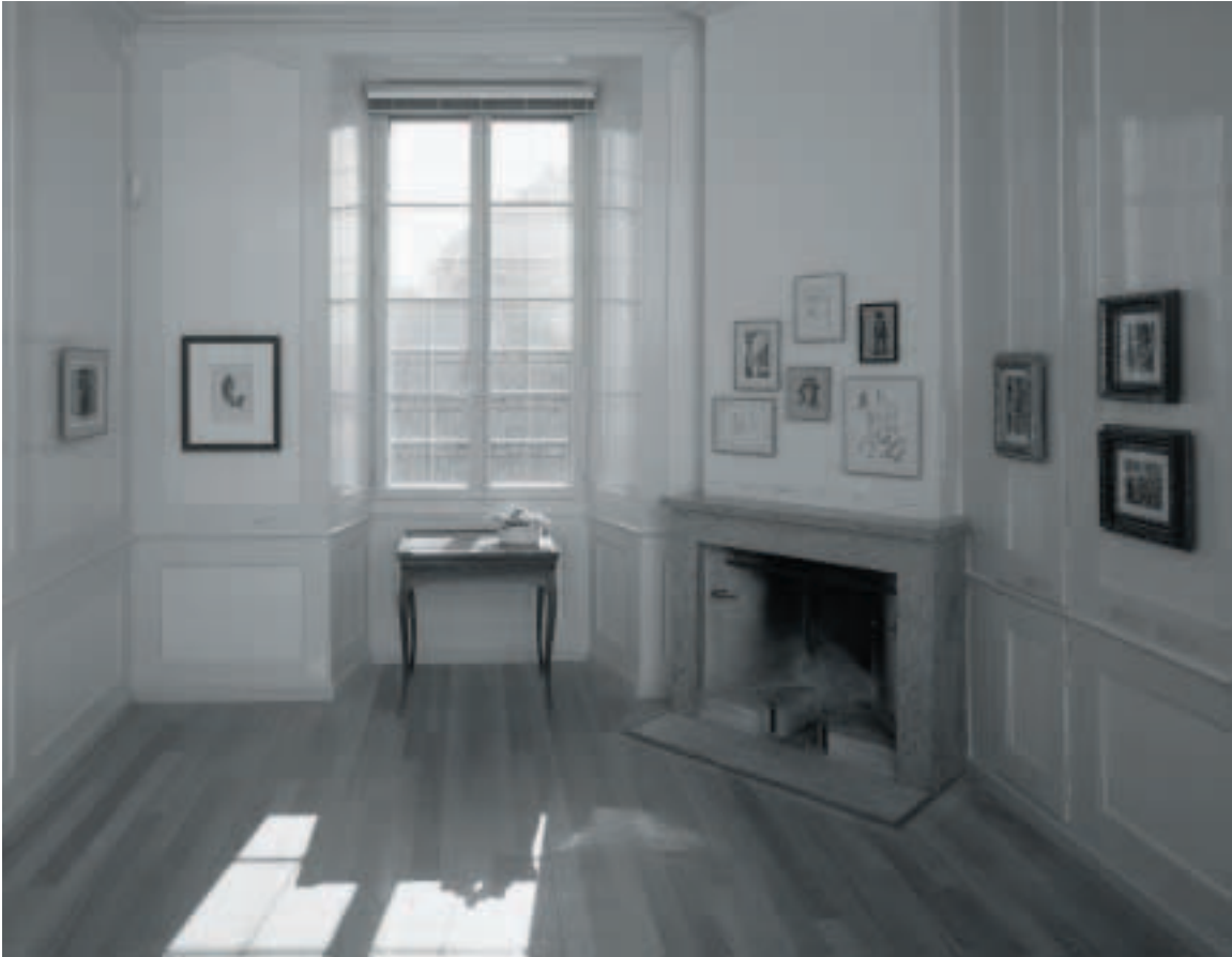
20 Die Hängung der Sammlung in den Räumen des Wichterheer-Guts, Oberhofen am Thunersee