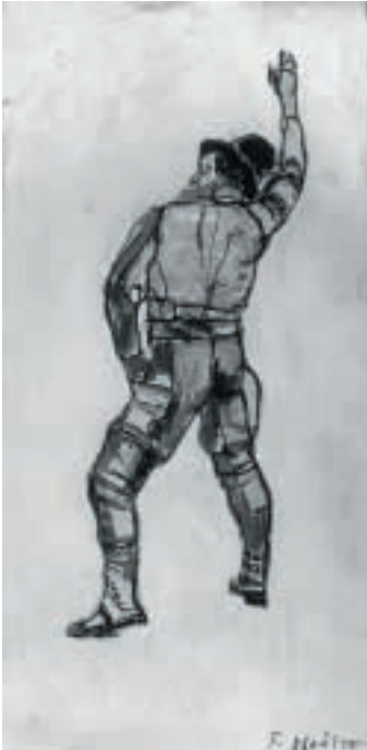
7 Ferdinand Hodler, Schwörender (Studie zu «Einmütigkeit»), um 1913, Öl auf Papier auf Leinwand aufgezogen, Privatbesitz (ehemals Sammlung Im Obersteg)