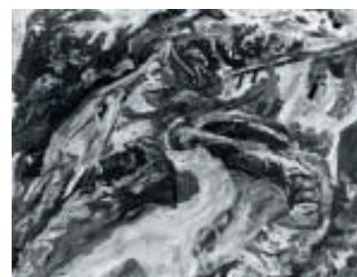
10 Chaïm Soutine, La route montante , um 1921, Öl auf Leinwand, 65 x 81 cm, Sammlung Rosengart, Luzern (ehemals Sammlung Im Obersteg)