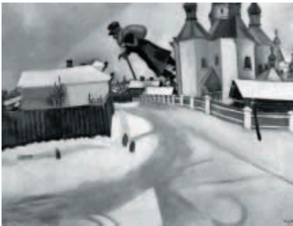
14 Marc Chagall, Über Witebsk , 1914, Öl auf Karton auf Leinwand, 70 x 91 cm, The Art Gallery of Ontario, Toronto, Ayala und Sam Zacks Collection (ehemals Sammlung Im Obersteg)