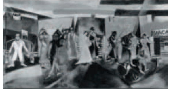
13 Marc Chagall, Die Hochzeit , 1910, Öl auf Leinwand, 98 x 188 cm, Centre Georges Pompidou, Musée National d'Art Moderne, Paris (ehemals Sammlung Im Obersteg)